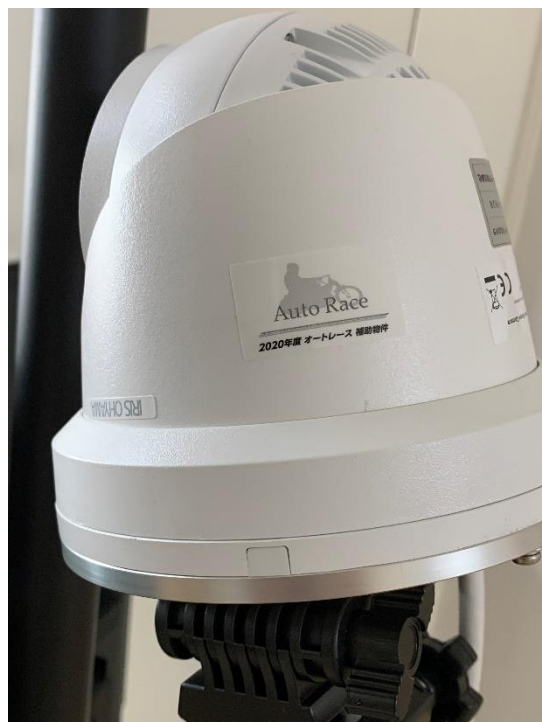
体温測定機器後部